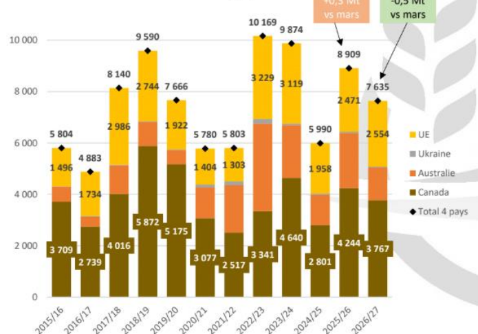
Stocks de colza à fin juin ajustés du surplus/déficit de la matrice (juillet-juin)

30 % engagé à 490 €/t en moyenne Matif Nous avons sécurisé un tiers de nos volumes. Si le matif revient dans la fourchette 500-510 €/t Aout26, nous songeons à monter à 50% des volumes.